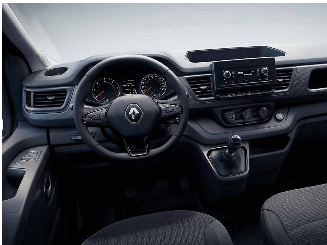
furgón de serie